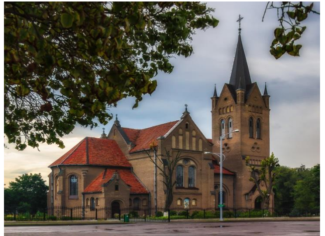
Фото 8. Храм Воздвижения Святого Креста