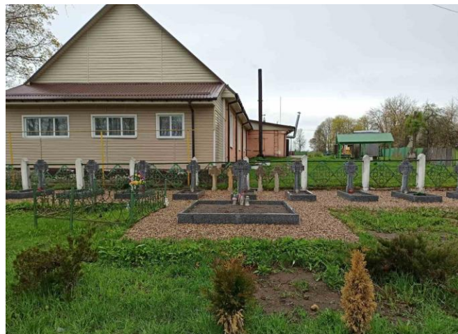
Фото 2. Могила 18 повстанцев 1863 г