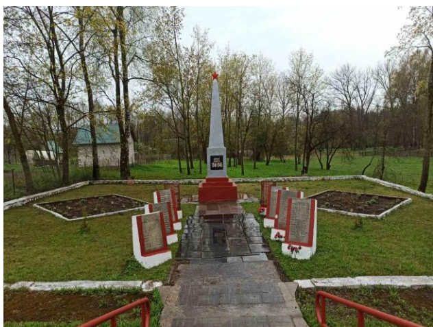
Фото 3. Братская могила