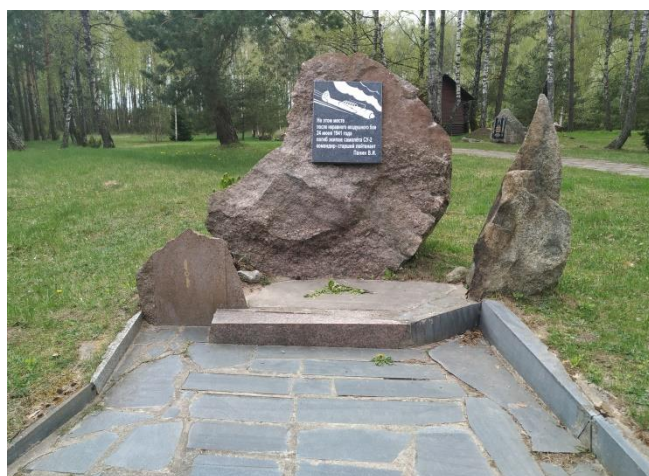
Фото 6. Памятный знак экипажу бомбардировщика «Су-2»