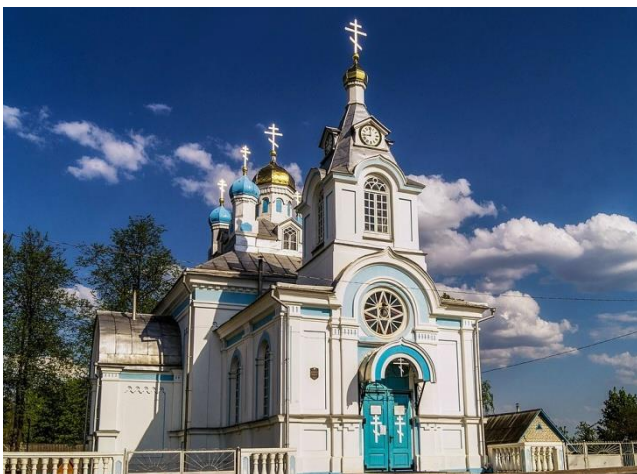
Фото 9. Храм преподобной Марии Египетской