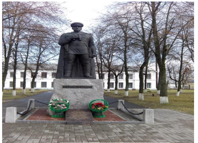
Фото 10. Памятник Ази Асланову