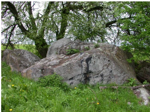
Фото 1. Валун «Гомсин камень»