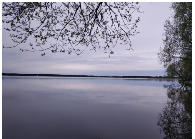
Фото 11-12. Вилейское водохранилище