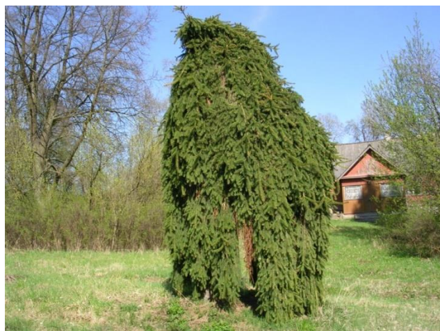
Фото 4. Памятник природы «Плакучая ель»