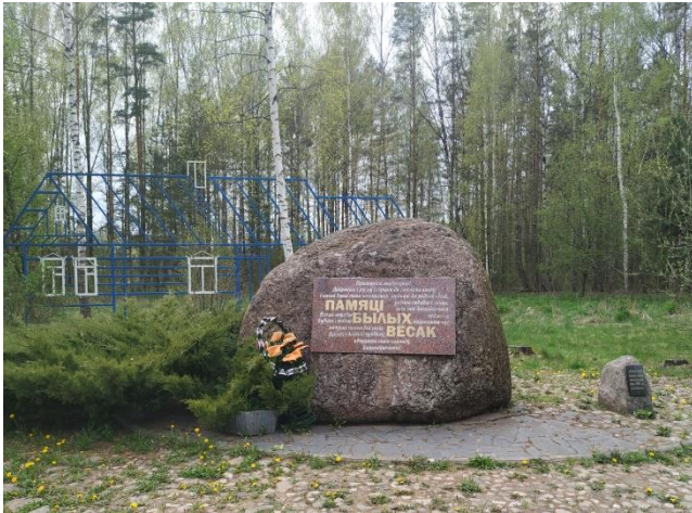
Фото 7. Комплекс «Памяці былых вёсак»